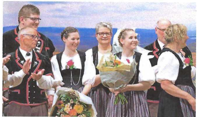
Genauso herzerfrischend wie der Jodlerklub freuen sich die Inset auf ihr Jodlerfest.

Am Freitag und Samstag gilt die volle Aufmerksamkeit den 2561 aktiv Teilnehmenden. Angesagt sind insgesamt 365 Vorträge, gesplittet in Jodeln (181), Alphorn (139) und Fahenschwinger (45). Nicht zu vergessen die 44 Vorträge aus dem Nachwuchstreffen, die am Samstag in der Drescherhalle erlebt werden können. Die Wettvorträge Jodel-